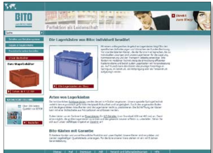
// WENIGER IST MEHR: EINE SEITE VOR UND NACH DER OPTIMIERUNG DER CONVERSIONS DURCH CLICK EFFECT.

pages die entsprechenden Marktgegebenheiten wie z.B. nationaler Wettbewerb oder Zweisprachigkeit berücksichtigt werden. Aber die Mühe hat sich gelohnt und das Ergebnis der bisherigen Zusammenarbeit kann sich im wahrsten Sinn des Wortes sehen lassen: Konkret führte sie zu einer erhöhten Sichtbarkeit von wichtigen Schlüsselbegriffen in vielen Ländern. Dies wiederum stärkt das Branding von Bito und führte bereits zu einer signifikanten Erhöhung der Besucherzahlen auf den Websites des Unterneh-